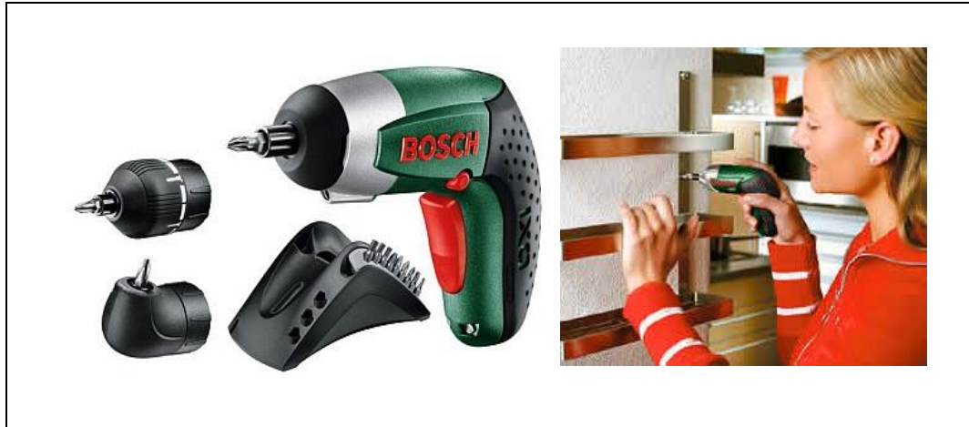
Abbildung 6: Bosch IXO Akkuschauber

Der Umsatz, den der Bosch IXO gleich in seinem ersten Jahr generieren konnte, spricht für sich. Er wurde fünfmal häufiger verkauft als die geschlechtsneutrale Variante. 67 Dabei hat sich herausgestellt, dass auch viele männliche Hobby-Handwerker den kleinen und dennoch leistungsstarken Akkuschauber nutzen. So hat sich ein Produkt, das ursprünglich für Frauen entwickelt wurde, zu einem Kassenschlager für die Bosch AG entwickelt. Mittlerweile ist der Bosch IXO das meistverkaufte Elektrowerkzeug der Welt. 68