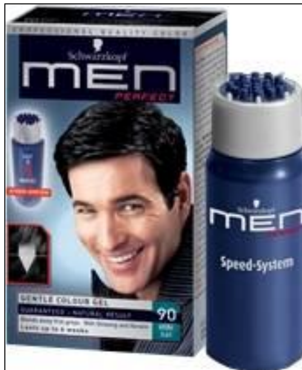
Abbildung 10: Das Haarfärbemittel Schwarzkopf MenPerfect

MenPerfect wird mit der Variante des sichtbaren Gender Marketings vermarktet. Das ist ganz logisch, da sich das Produkt so gleich von den Haarfärbemitteln, die für Frauen gedacht sind, unterscheiden lässt. Allein schon der Name und das Verpackungsdesign des Produkts machen klar, dass Männer die Zielgruppe sind.