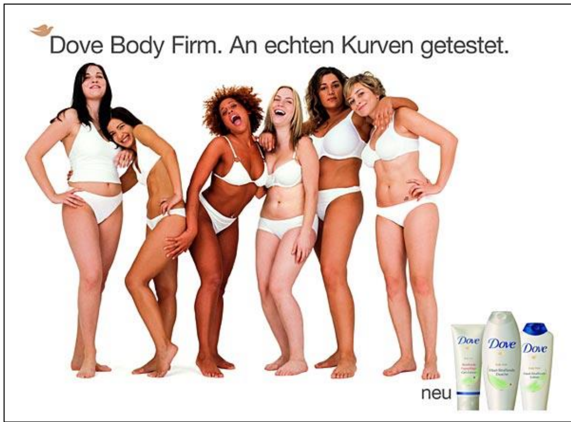
Abbildung 7: Dove Werbeanzeige

Das Unternehmen Unilever betreibt so Gender Marketing. Dass sich diese Mühe auch auszahlt, zeigt sich daran, dass "Unilever Deutschland [...] seinen Umsatz innerhalb eines Jahres um 77 Prozent steigern" 125 konnte.