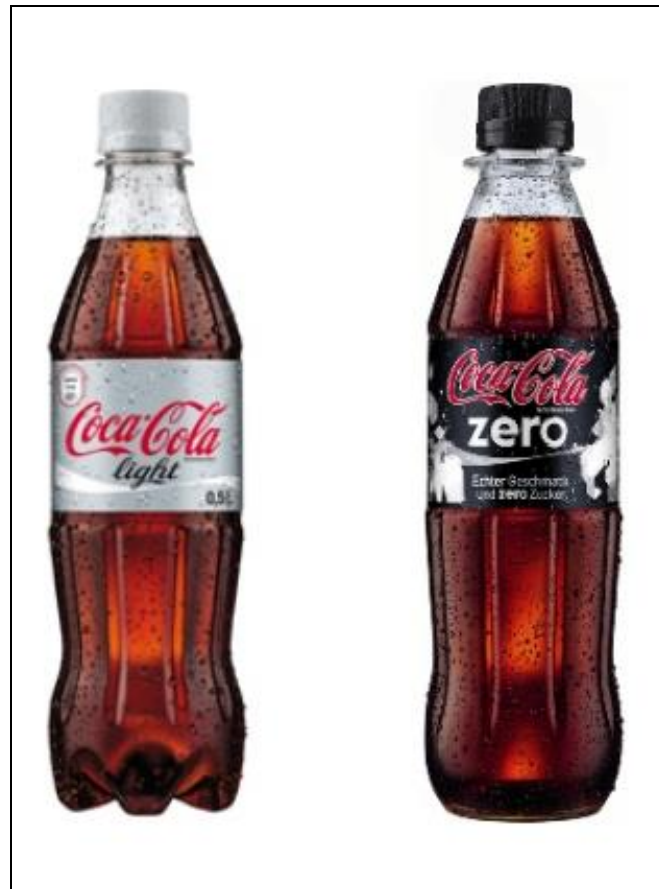
Abbildung 8: Coca Cola Light und Coca Cola Zero

Anhand der auffällig unterschiedlichen Werbespots für die beiden Produkte kann man deutlich erkennen, an wen die Werbung gerichtet ist. Beides sind kalorienreduzierte Colagetränke, doch die Werbebotschaft von Coca Cola Light ist an Frauen und die von Zero eher an Männer gerichtet. In den 90ern und zu Beginn des neuen Jahrtausends spielte der Cola Light -Mann eine wichtige Rolle in den Spots für Coca Cola Light . Ein gut gebauter Handwerker, der eine kühle Cola Light aus der Dose trinkt, sorgt dafür, dass hübsche Geschäftsfrauen sich benehmen wie verliebte Teenager. Ob das Frauenbild, das in diesen Spots dargestellt wurde, die den Frauen so wichtige Realität zeigte, ist fraglich. Coca Cola hat mit einer neuen Kampagne reagiert. Inzwischen sprechen die Spots die Frauen anders an. Meist wird die freche, selbstbewusste Frau gezeigt, die tut was sie will und dabei genüsslich ihre Cola Light aus der Flasche trinkt. Damit kann sich die moderne junge Frau eher identifizieren.