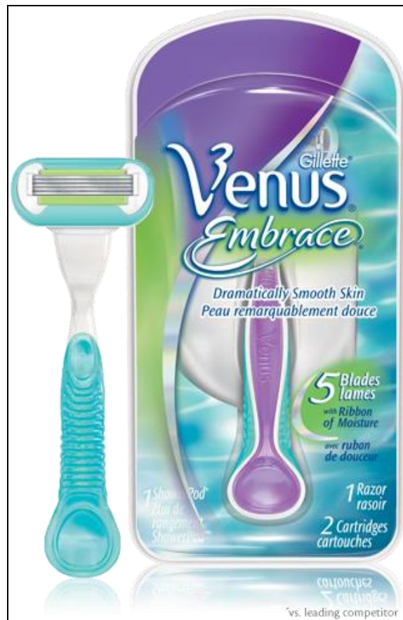
Abbildung 4: Damenrasierer Venus Embrace von Gillette

Auch ohne die Aufschrift " for Women " ist anhand der Form und Farbe schon zu erkennen, dass es sich hier um einen Damenrasierer handelt. Gillette hat den ursprünglichen Rasierer so modifiziert, dass er den hohen Anforderungen der weiblichen Nutzer genügt. 63