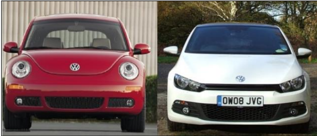
Abbildung 2: Vergleich der Frontansicht von VW Beetle und VW Scirocco

Dies sind nur einige der wichtigsten Unterschiede im Verhalten und der Wahrnehmung von Männern und Frauen, die im Marketing eine Rolle spielen. Wie genau sich diese auf die einzelnen Bereiche des Marketing-Mixes auswirken, wird nun anhand der 4 Ps im Detail erklärt.