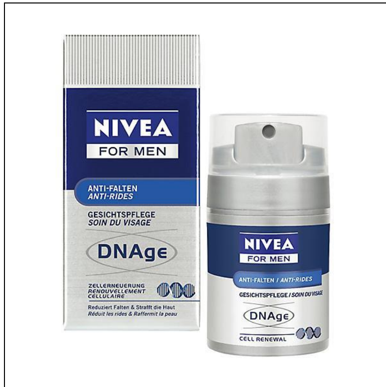
Abbildung 5: Nivea for Men Gesichtsscreme für Männer

Die sichtbare Vermarktungsmethode kann allerdings auch problematisch sein. Wenn man bei bestimmten Produkten eindeutig "for Women" oder "for Men" darauf schreibt, grenzt das die Zielgruppen eventuell zu stark ein. Auch ein zu weibliches Design, wie beispielsweise Blümchenmuster oder rosa Farbe wirkt in manchen Fällen eher abstoßend oder sogar diskriminierend. Frauen wollen nicht unbedingt ein Frauenprodukt. 64 Besonders bei Produkten, die grundsätzlich von beiden Geschlechtern gleichermaßen genutzt werden, eignet sich die Variante des unsichtbaren Gender Marketings besser.